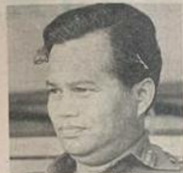
KILLED ... generals Datuk Mustafa and (below) Datuk Hasbullah