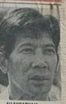
ALLAHYARHAM BRIG-JEN HASBULLAH