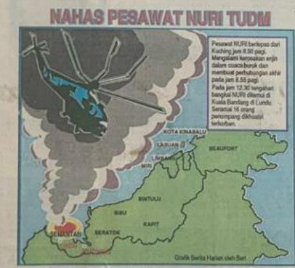
NAHAS PESAWAT NURI TUDM